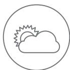
Luz del día