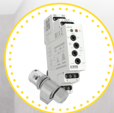
LIC-2 + fotosensor SKS